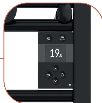
Boîtier de commande digital